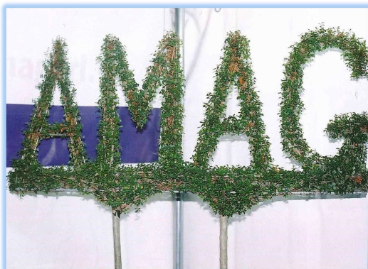
↑マットトピアリー（海外事例）