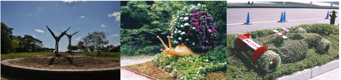
◆ネバーランド制作のトピアリー◆

トピアリーの語源はラテン語の「opus topiarium（造園家の仕事・作品）」といわれ、NPO 法人日本トピアリー協会では「植物を人工的・立体的に形づくる造形物」と定義しています。花や樹木などで作る造形物は、現代の自然志向、環境志向にマッチしたもので、子供から大人まで幅広い人気があり、新しい園芸文化として注目されています。イベントのディスプレイやフラワーショップの店頭で、クマやウサギの形をしたトピアリーに人気が集まっています。地球環境の保全が叫ばれる中で、「緑のぬいぐるみ」として世界中の多くのファンに愛されています。イベントやキャンペーンといった一時的なディスプレイ・展示から施設などの常設トピアリー、大型トピアリーから、会社のロゴマークやシンボルマーク、マスコットキャラクターなど多様なトピアリーを制作することが可能です。